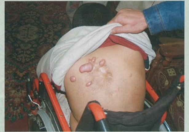
米兵の「気まぐれ発砲」で下半身不随に。ディア君家族には何の補償もない