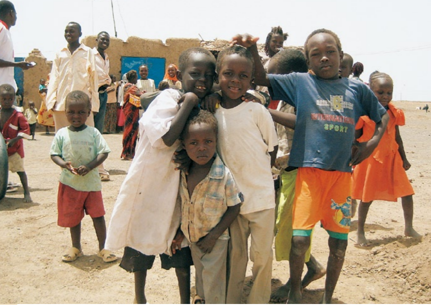
ダルフルから逃げてきた子どもたち (ハルツームで)

UNHCRのプロペラ機に乗ってスーダン・ウガンダ国境の町、ニムレへ。眼下には白ナイル川とジャングル。