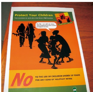
ユニセフのポスター 子どもを少年兵にさせてはいけない

自衛隊をできるだけ海外へ派兵し、「既成事実」を作り、「派兵恒久法」を成立させたい。そして何よりもスーダン中部にある油田利権…。そんな政治的な思惑で、自衛隊派兵が計画されたのだと思う。スーダンの人々が何を望んでいるか、今行うことは何なのか。そうしたことを考えるならば、それは軍隊ではなく、日本企業の出番だろう。憲法9条の平和精神に立ち返れば、おのずと日本のやるべきことが見えてくると思うのだが。