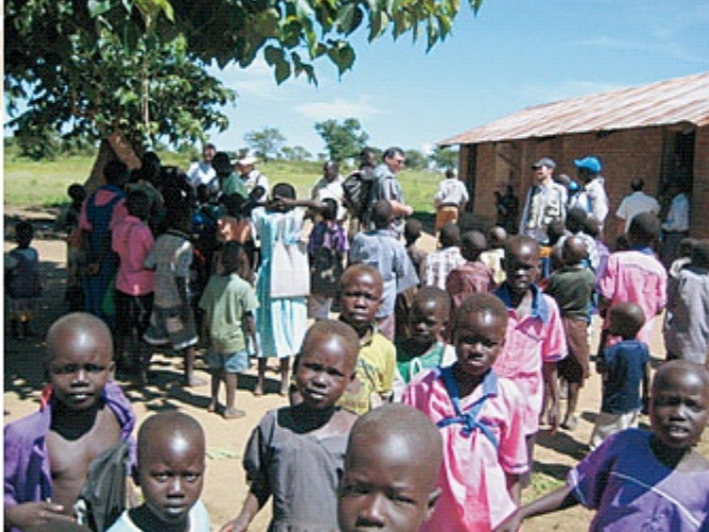
ニムレ・ガンジ村の青空学校

首都ハルツームに到着。川と青ナイル川が合流する地点で、エジプトの支配を経て、イギリスの植民地となった歴史を持つ。住民はアラブ系が多数で、黒人はマイノリティだ。街ではアラビア語が話され、厳格なイスラーム主義国なので、酒を売る店は皆無。たまに東洋系の人物を見かけるが、ほぼ間違いなく中国人のビジネスマンだ。実際、私が市場などで買い物をしていると、アラブ人たちから「ニイハオ」とあいさつされる。