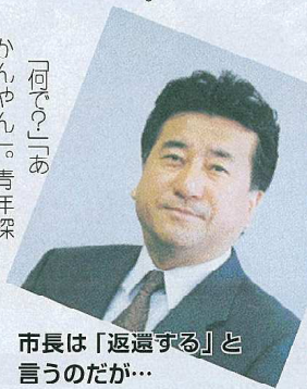
市長は「返還する」と言うのだが…

「吹田市長のパー券購入」「西松建設側2団体、100万円」。今年3月、新聞各紙がいつせいに報道した「吹田市版西松事件」。小沢一郎前民主党代表や二階俊博経産相など大物政治家に交じって、阪口吹田市長も「献金」をもらっていたのだ。