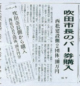
西松疑惑を報道する各紙

「何で」「あかんやん」。青年探偵たちはいつせいにブーイング。肝心の吹田市民はどう思っているのか？春の陽気に誘われてJR吹田駅前で街角アンケートを取ってみました。