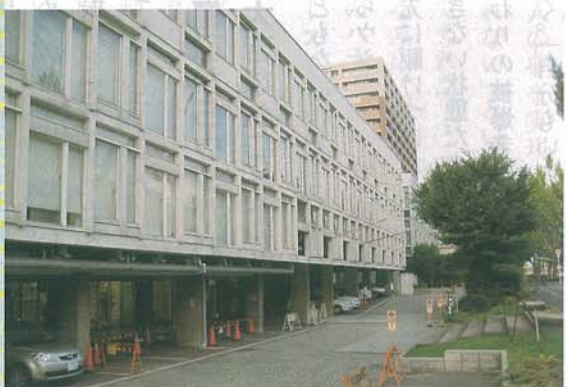
取り壊される運命の南千里駅前ビル (Cゾーン)