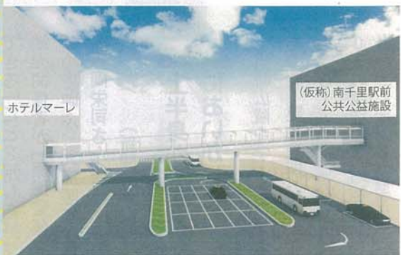
千里南地区センター再整備事業 (交通広場建設工事) イメージ図 (Aゾーン)

AQ 今回の駅前再開発で、街はどのように変わりますか？ 南千里駅前再開発事業は、大きく3つのパートに分かれ