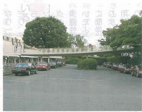
現在のタクシー乗り場付近が(仮称)南千里駅前公共施設に (Bゾーン)

A部分、交通広場の再整備から取りかかって、2011年4月には供用開始予定です。B部分(仮称)南千里駅前公共施設整備事業は、PFI事業者選定がすでに終了。来年度中に工事を開始し、2012年4月にオープンする予定です。C部分、公共広場の工事は、その後になりますね。